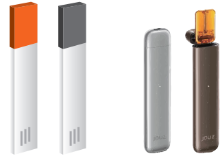
(왼쪽부터) 국내 출시를 앞두고 있는 졸 유사 담배제품인 KT&G의 릴 베이퍼, 일본 조즈