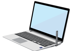
컴퓨터를 활용해 충전가능 (이럴 경우 마치 USB를 사용하는 것처럼 보일 수 있음)