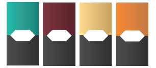
팟(액상카트리지) 맛에 따라 색상이 다름